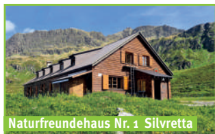
Naturfreundehaus Nr. 1 Silvretta